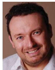
Frank Wind Anzeigenverkauf

Gefahrgutbeauftragte diskutieren hier die speziellen Probleme ihrer Branchen: in der Chemischen Industrie, im Handel, in Speditionen und bei der Bahn, in den Kommunen und bei der Bundeswehr.